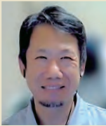
Mさん キャリアコンサルタントの勉強に励む会社員

大学受験の直前の娘が進路に迷い出しました。たくさんの「こうあらねば」に縛られた以前の私なら、おろおろしたり、アドバイスを押し付けていたはず。しかし、講座のプログラムを活かし、娘の話を最後まで聴き切ることができました。これから進みたい道、在りたい自分について、たくさん迷いながら考えている娘の言葉をただ受け取りながら、娘への愛おしさ、娘の存在への敬意が湧く時間となりました。