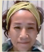
Rさん(3人の息子の母) 生麩と葛の専門店経営

自分の信じていた事が変わったら面白いと思い始めた頃に「パラダイムシフト」という言葉を知り、「パラダイムシフトコミュニケーション®」に参加しました。不確実な世の中を楽しめるようになってきた今、社内で度々襲われる劣等感に落ち込むよりも、自分の成長を承認して行動することが増えてきました。自分を活かす生き方を見つけて、資格取得に向けて勉強中です。こんなに楽しい勉強は初めてです。