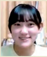
Sさん(Yさん娘) 大学生

軽やかに、そしてイキイキしてきた参加者の母に魅かれて、私も進路実現を目指し参加しました。志望した大学に進んだ今は、ボランティア活動・講義やバイトなどの日程がきれいに整い全てに参加できたり、学びたいことを学べる環境がすぐに手に入ったりしています。とても人見知りなのですが、自分の意図を伝え、必要なコミュニケーションを自分から起こせるようになったことも、参加して自分に創った結果です。